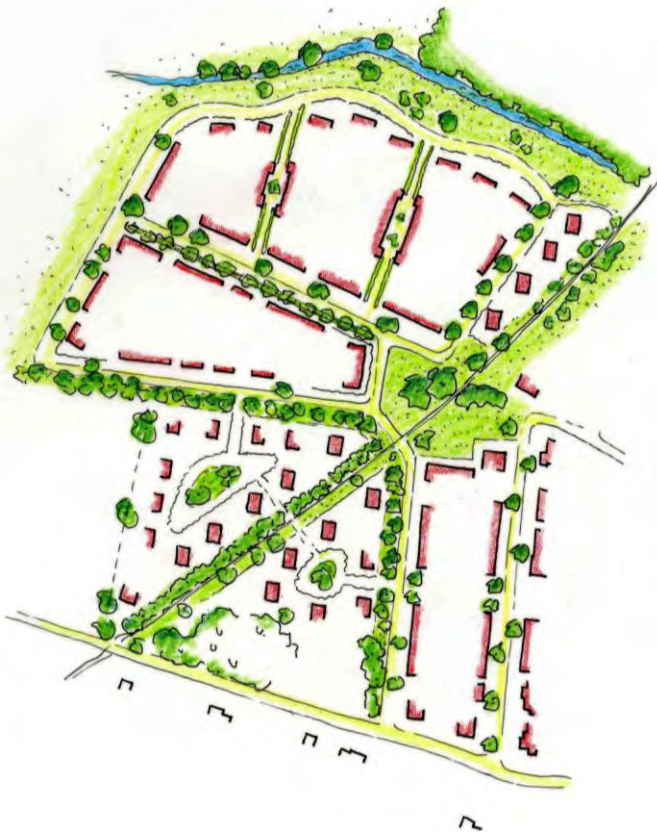
afbeelding 4: hoofdstructuur Bovenkamp II

Ter weerszijden van het voormalige spoortracé zijn kavels met vrijstaande woningen gesitueerd. Deze gebieden vormen een eigen woonmilieu in de vorm van een groepering van woningen rondom een pleintje met plantsoen. Deze pleintjes zijn onderling verbonden door een voetpad over het voormalige spoortracé. Dit voetpad maakt onderdeel uit van een langzaam verkeersroute vanuit Bovenkamp I (Scheperskamp / Bornkamp) via het hofje aan de noordzijde van de hoofdstraat naar de wadi van de Wendhorst beek. Deze route kruist alle landschappelijke patronen en structuren en daarmee wordt de inbedding van Bovenkamp II in het landschap zichtbaar en tastbaar.