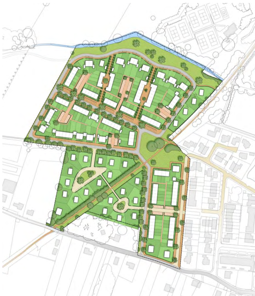
afbeelding 3: stedenbouwkundig plan Bovenkamp II

Het bouwen in een bijzonder landschap als dat aan de westzijde van Heerde vereist een zorgvuldige benadering van de ruimtelijke ingrepen met als doel de landschappelijke kwaliteiten te benutten en beleefbaar te maken. In het stedenbouwkundig plan is daarom gekozen voor een compositie waarin doorzichten en zichtlijnen naar het landschap een belangrijke rol spelen. Op die wijze wordt het landschap op een transparante wijze betrokken in de ruimtelijke beleving van de woonomgeving. De Brink vormt het “hart” van de woonbuurt Bovenkamp I en II. Vanuit dit hart is het omringende landschap via vista's zichtbaar. De Brink is een nieuw element dat verwijst naar een voor Heerde bekende typologie van kruispunt van routes. In Bovenkamp vormt het een kruispunt van straten, paden en groenstructuren. Dit is ook voor fietsers op het lange afstandspad, het voormalige spoortracé, een herkenningspunt en verpozingplek. Een drietal bestaande oude eiken worden als solitaire bomen op deze plek ingepast. Deze bomen maken voor een belangrijk deel de kwaliteit van deze nieuwe Brink. De hoofdentree van Bovenkamp II is vanaf de Wezeweg. Deze hoofdentree wordt begeleid door een brede groenzone met een diversiteit aan bomen. Deze toegang is gericht op de Brink. Vanaf deze Brink ontplooit Bovenkamp II zich in westelijke richting door een tweetal straten met uitzicht op het