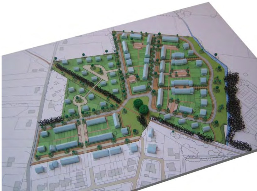
afbeelding 6: ruimtelijke opzet Bovenkamp II

Voor geheel Bovenkamp II geldt straatgericht wonen als uitgangspunt om betrokkenheid van het wonen op de openbare ruimte stimuleren. Hiermee wordt de openbare ruimte naast verkeersruimte ook sociale ruimte. Daarnaast is de culturele waarde van belang. Deze komt tot uiting door in de vormgeving van de openbare ruimte bij te dragen aan de landschappelijke verankering van de nieuwe woonbuurt. Continuïteit en samenhang van landschappelijke elementen worden nagestreefd. De volgende hoofdelementen van het plan waarborgen deze verankering.