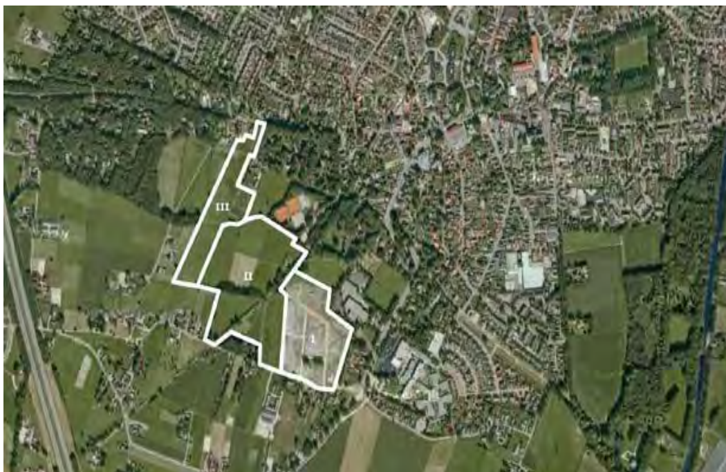
afbeelding 1: ligging plangebied Bovenkamp I, II, III geprojecteerd op luchtfoto

Het plangebied Bovenkamp II ligt ten zuidwesten van de kern van Heerde en is gescheiden van de kern door een groene zone, waarin onder andere sportvoorzieningen, een scholencomplex en grote particuliere kavels zijn gesitueerd. Daarmee neemt de locatie ruimtelijk een zelfstandige positie in als uitbreidingsgebied van het dorp Heerde. Landschappelijk ligt het gebied op de zoom van de Veluwe en wordt hier gekenmerkt door een bijzonder fraai landschap bestaande uit grote groene kamers met graslanden, houtwallen en bosschages. Midden door het gebied stroomt de Wendhorstbeek. Dit is één van de sprengen uit het Veluwemassief, deze beek vormt de noordelijke begrenzing van de locatie Bovenkamp II. Een fietspad loopt diagonaal door het plangebied en herinnert aan de voormalige spoorlijn. Dit tracé is ooit als nieuwe laag op het oude cultuurlandschap gelegd en vormt hierdoor een scherpe doorsnijding van het oorspronkelijke kavelpatroon. Aan de oostzijde grenst de locatie aan de onlangs gerealiseerde buurt Bovenkamp I. Deze buurt wordt ontsloten vanaf de zuidelijk gelegen Wezeweg. Dit zal voor Bovenkamp II eveneens gaan gelden. Aan de westzijde wordt in de toekomst met Bovenkamp III de stedenbouwkundige uitleg gecontinueerd. Deze ontwikkeling zal dan in noordelijke richting gaan tot aan de Elburgerweg.