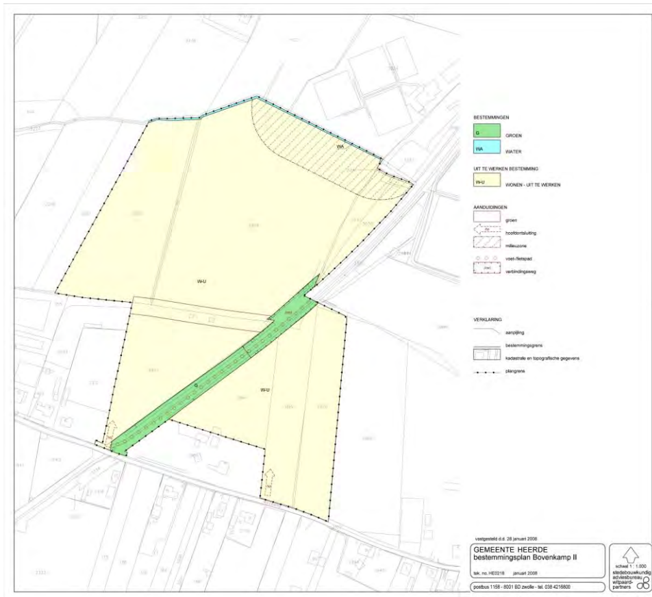
afbeelding 2: Bestemmingsplan Bovenkamp II

Het geldende bestemmingsplan is het globaal uit te werken bestemmingsplan Bovenkamp II, dat op 28 januari 2008 is vastgesteld door de gemeenteraad van Heerde. Het goedkeuringsbesluit van gedeputeerde staten heeft van 28 mei tot en met 9 juli 2008 ter visie gelegen. Aangezien er geen beroep is ingesteld het goedkeuringsbesluit is het bestemmingsplan op 10 juli 2008 in werking getreden. Tevens is op 30 mei 2011 vastgesteld herziening I van het bestemmingsplan Bovenkamp II. In het bestemmingsplan Bovenkamp II wordt uitgegaan van twee hoofdontsluitingen van Bovenkamp II. Met de herziening I kan ook met één hoofdontsluiting worden volstaan.