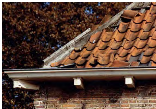
Voor het vervangen van slechte dakpannen door pannen van dezelfde soort en kleur is geen vergunning nodig.