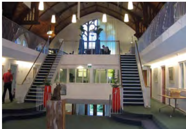
Voor het verwijderen of vervangen van een recente, niet-monumentale trap is geen vergunning nodig.

Een bouwhistorisch onderzoek kan veel inzicht bieden in de geschiedenis van uw pand. En het kan u helpen een goed plan te maken. In ons land is een aantal bouwhistorische bureaus actief. Zie ook www.bouwhistorie.nl