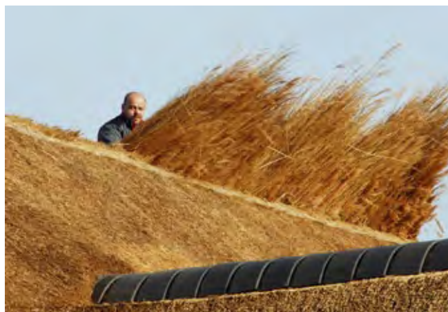
Voor het opstoppen van een rietdekking is geen vergunning nodig. Maar wanneer al het riet wordt vervangen is wel een vergunning nodig.