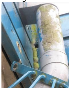
Foto 2: Het met purschuim gedichte gat, met het daarnaast aanwezige gat.

De drie in het plangebied aanwezige gebouwen zijn mogelijk geschikt als verblijfplaats voor vleermuizen (Laatvlieger en de Gewone Dwergvleermuis). In het gebouw van de Margrietschool zijn diverse openingen aanwezig in de dakrand. Op 1 plek is een gat gedicht met purschuim, maar ernaast zit nog steeds een groot gat waar een vleermuis met gemak doorheen kan. De gebouwen hebben een spouwmuur en een hoge schoorsteen is aanwezig. Bovendien staan langs de Rhijnsburglaan Beukenbomen, waardoor deze straat wellicht geschikt is als foerageerroute. Sporen van vleermuizen (uitwerpselen) zijn niet gevonden tijdens het veldbezoek.